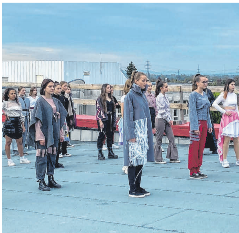
Die Schülerinnen der HTL Dornbirn filmten eine alternative Modenschau auf dem Dach des Schulgebäudes.