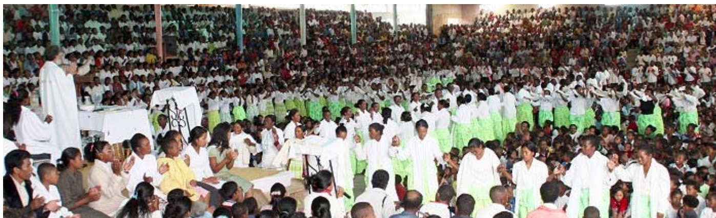
Sonntagsmesse in der Sporthalle Akamasoa