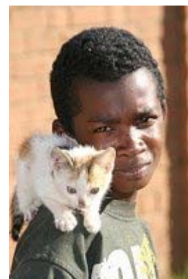
Kind in Akamasoa