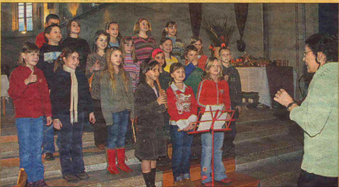
Stimmungsvolle Umrahmung – Kinder der Musikvolksschule sangen bei der Eröffnung.